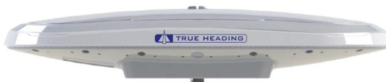
Nästa generations GNSS kompass Vector V200

True Headings produktsortiment omfattar också avancerade lösningar för positionering och kurshållning. Våra GPS kompasser har en omfattande marknadsandel på den svenska marknaden med bl.a. Waxholmsbolaget som en av de större nyttjarna. Under våren 2019 lanseras en helt ny generation satellit kompasser som kommer att erbjuda inte bara positioneringsnoggrannhet och prestanda baserat på amerikanska GPS utan även på ryska GLONASS, EU:s GALILEO och Kinesiska BEIDOU. Från ett satellitnavigeringssystem till fyra stycken samtidigt i en produkt.